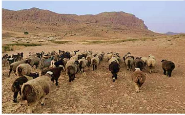
イラン西部・ザクロス山脈で遊牧生活をする民族の織りなす絨毯。織りの技術は、ユネスコの無形文化遺産にも登録され、価値も高く、人気です。

主なデザインとしては世界の中心(神、太陽)を表すメダリオン、豊かな自然と途切れない永遠を表す唐草文様、外壁や扉を意味するボーダーで構成される事が多い。イスラム教の寺院モスクの天井を仰ぎ見た様な構図のドームデザインは、エキゾチックで神聖な雰囲気です。