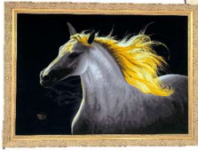
ペルシャの伝統的な細密画 (ミニチュール)を再現した 絵画絨毯